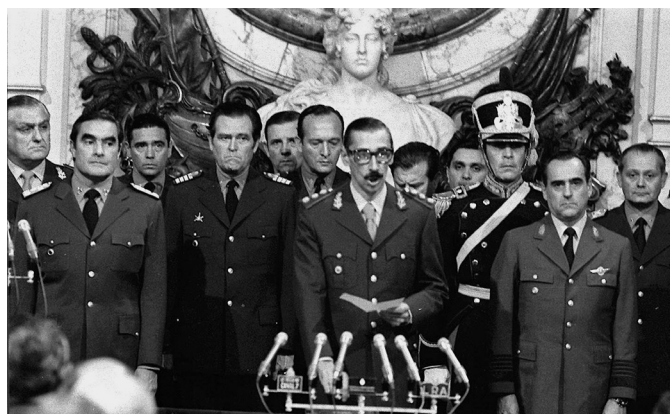
Jorge Rafael Videla jurando su cargo como presidente de facto el 29 de marzo de 1976

de hecho rápidamente tras el golpe reconoció a la junta militar, buscando así frenar los movimientos de izquierdas, a los “subversivos”.