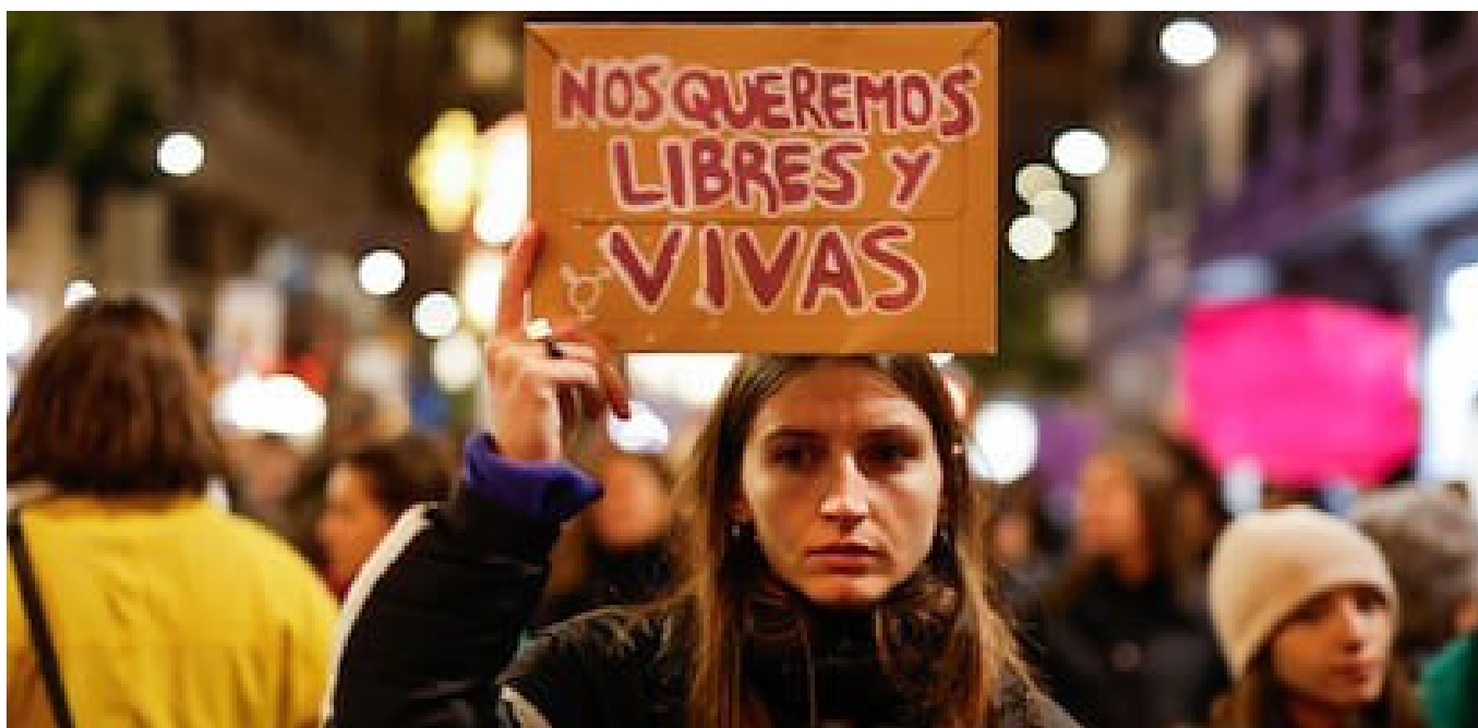
Manifestación del 25-N en Barcelona.

particulares sino también a todas las instituciones, incluidas las “progresistas”, que recortan presupuestos habiendo vidas en juego, entre otras cosas. Hay que mirar hacia delante y sacar todas las consecuencias de las injusticias y desigualdades, de todas las opresiones -donde la de la mujer es una de las más odiosas-, pero también de la violencia racista, económica, laboral..., y comprender que ninguna ley va a cambiar pensamientos profundos y prejuicios alimentados por el poder de los que tienen dinero, dinero de verdad, por los poderosos, a los que no conviene nada que las mentes de mujeres y hombres avancen y lleguen a