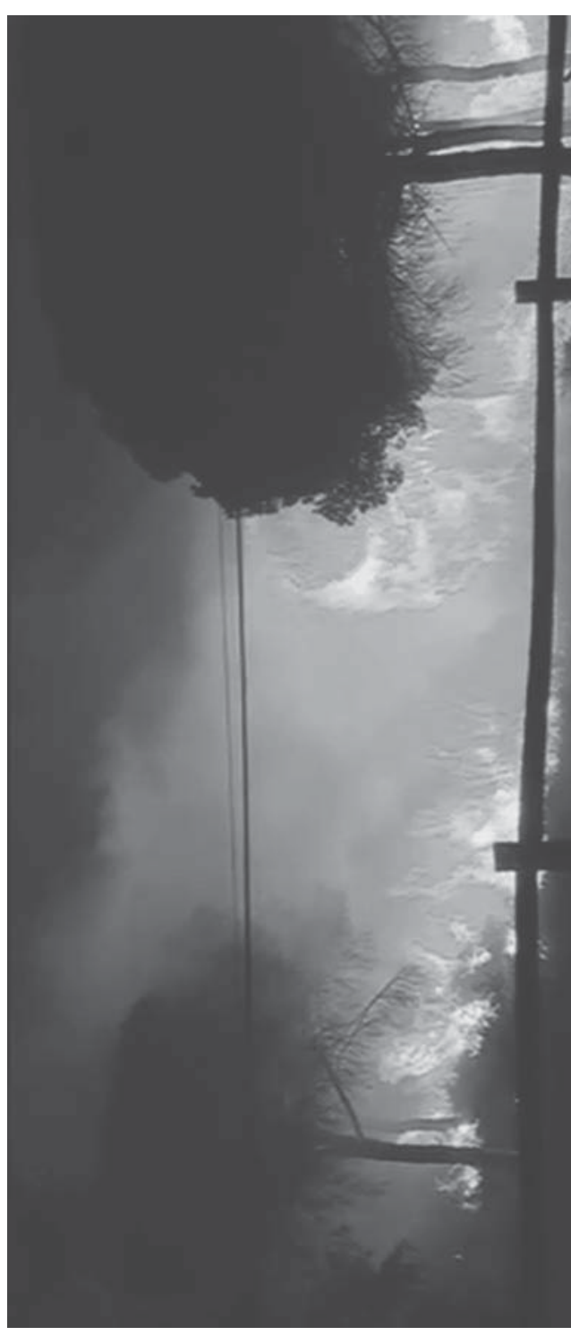
Julio de 2017

El desastre del incendio, no tiene sólo consecuencias medioambientales o económicas, demuestra con más nitidez que la única salida es la implantación de una economía basada en las necesidades sociales, llevada a cabo por y para la clase trabajadora y la sociedad en su conjunto.